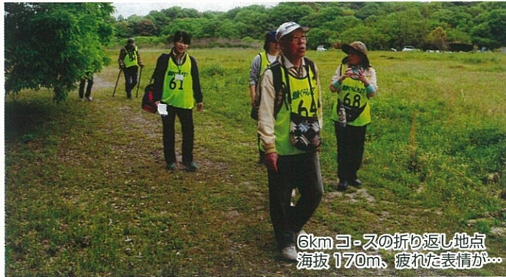
6kmコースの折り返し地点 海拔170m、疲れた表情が...