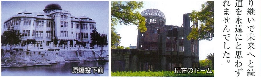
原爆投下前 現在のドーム