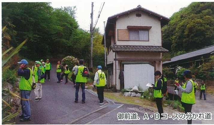
御前道、A・Bコースの分かれ道

ライン側を山道に入り、水源近くまで歩く6kmコースでウォーキングを楽しみました。幸いに雨にもあわず全員元気に帰ることが出来ました。食事会場の公会堂では、恒例の婦人会手作りの豚汁と混ぜご飯を頂きました。参加者は心地よい疲れを感じながらも話に花を咲かせていました。参加者の皆様お疲れさまでした。来年もみんなで楽しく歩きましょう。