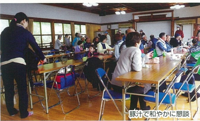
豚汁で和やかに懇談