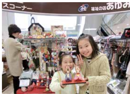
福祉の店「あゆみ」でお気に入りを見つけてね♪

※倉敷レディスボランティアグループでは、一緒に活動してくださるボランティアさんを募集中！ お問い合わせは、倉敷市社協まで。(☎434-3301)