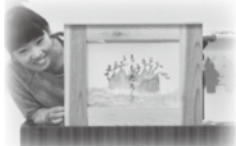
紙芝居の読み聞かせの様子

「今後は、子ども達の参加が増える様に広報活動に力を入れ、より活発にしたい」と、熱い思いを会長が語ってくださいました。