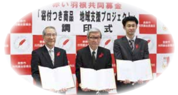
三盛物産様(左)と倉敷市共同募金委員会会長とシャングルーブ(有)シャン様(右)

また、商品・サービスを購入する方は、自分の欲しい物を買うことで地域の福祉活動を支援できるという、企業等、購入者、共同募金会の三者にメリットがある関係づくりを目指すものです。