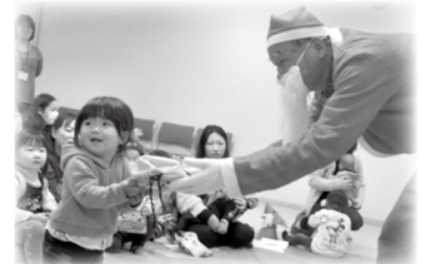
クリスマス会の様子

夏には夏まつり、秋にはどんぐり拾いに出かけたりと、季節に合わせた活動をしています。12月の「クリスマス会」は、地区社協の副会長がサンタクロースになり、子どもたちにプ