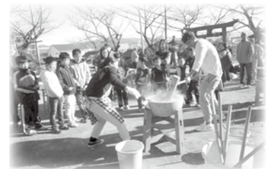
三世代もちつき大会

のみなさんも苦労されましたが、現在は慣れてきて、メニューの分担を決めて、和気あいあいと楽しみながら作っており、よい交流の機会にもなっているとのことです。その他、健康教室（毎週 1 回ラジオ体操とストレッチ）、歩こう会（児島保健推進室による健康講座と風の道のウォーキング）、幼稚園児との交流会、友愛訪問（一人暮らしの高齢者）、福祉施設との交流、子育て支援（アップルの会）、三世代交流もちつき大会、小地域ケア会議等を行っています。