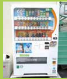
松屋ガラス店様が店舗(水島川崎通)前の道路に設置していただきました。