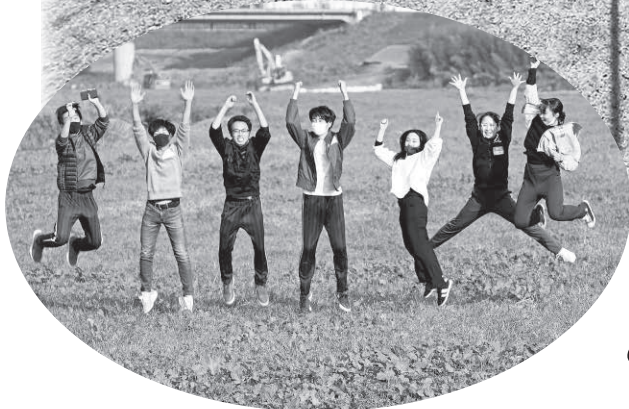
▲夢へ向かってジャンプ