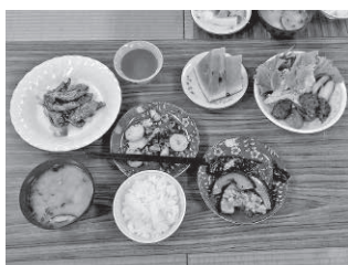
とても美味しそうです！