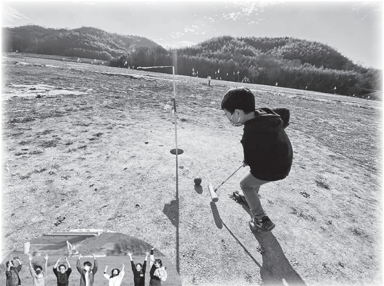
▲小田川の河川敷でマレットゴルフ