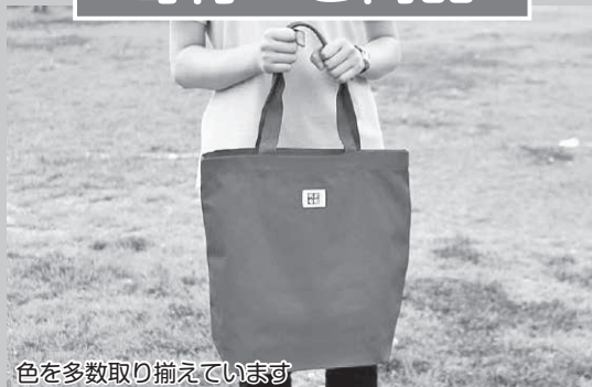
色を多数取り揃えています