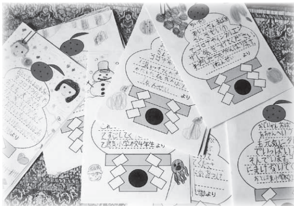
小学生がひとり暮らしの高齢者に向けて書いた手紙 (乙島東地区社協の取り組み)

コロナ禍で、地域住民が主体となる地域福祉活動の自粛が増加し、閉じこもりがちになる高齢者の身体機能の低下、社会的孤立の深刻さ等が浮き彫りになっています。