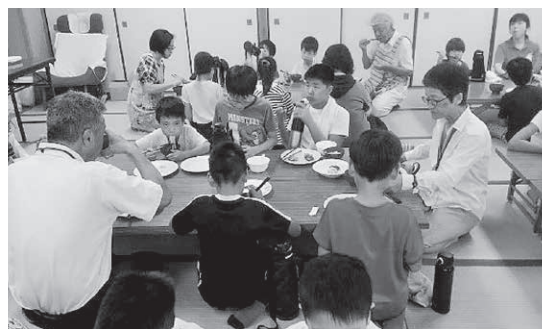
ふれあい会食会の様子