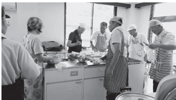
料理をつくるみなさん

穂井田地区は、田畑や山に囲まれた自然豊かな地区で、人口は1,469人、高齢化率は41%です。人口が少なく、高齢化率も高いですが、地域のつながりが強く、互いに支え合う土壌があります。