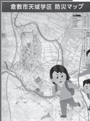
令和2年度に天城地区全3,400世帯に配布

このマップは各町内会や家族間で災害時の避難経路や避難場所を話し合ったり書き込んだりして減災や防災意識を高めてもらう狙いがあります。