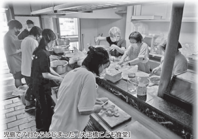
児島で7月から始まった「大正橋こども食堂」 元お寿司屋さんの空き店舗が、みんなの力で地域の居場所に!