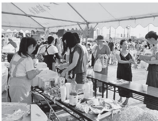
大高地区の風物詩の夏祭り

大高地区社協は、大高地区にある7つの町内会で構成され、平成21年5月の設立以来『地域のつながりの充実』に重点をおいて活動を続けています。大高夏祭りや大高運動会、グラウンドゴルフ大会やふれあい会食会といった活動を行っています。